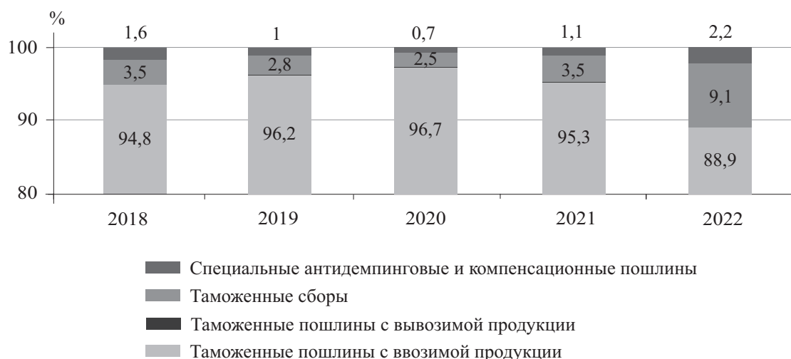
Рис. 2. Структура налогов на международную торговлю и внешние операции, 2018–2022 гг. 9 , %

В 2022 г. общий объем налогов на международную торговлю и внешние операции снизился по сравнению с 2021 г. на 19,7 %, или на 5 010,4 млн сомов, в большей степени за счет снижения объемов поступления импортных пошлин на 5 967,2 млн сомов, или на 22,7 %. При этом общий объем сборов увеличился за этот период в 2 раза, или на 955,7 млн сомов, в основном за счет увеличения объемов таможенных сборов в 2 раза, или на 819,6 млн сомов.